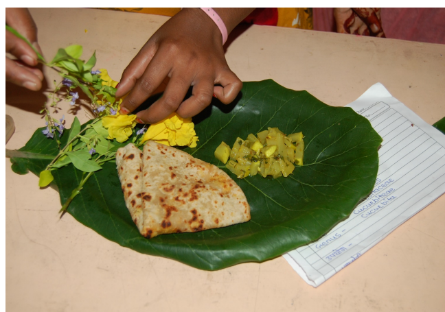
Wild vegetable Pumpkin