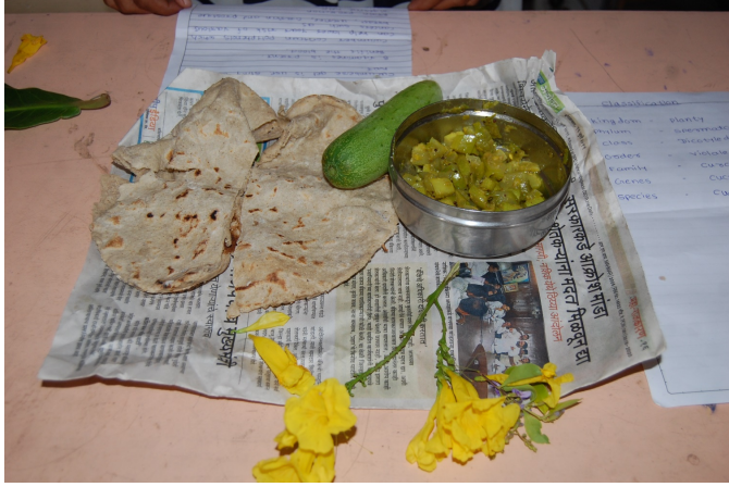
Wild vegetable Kartuli