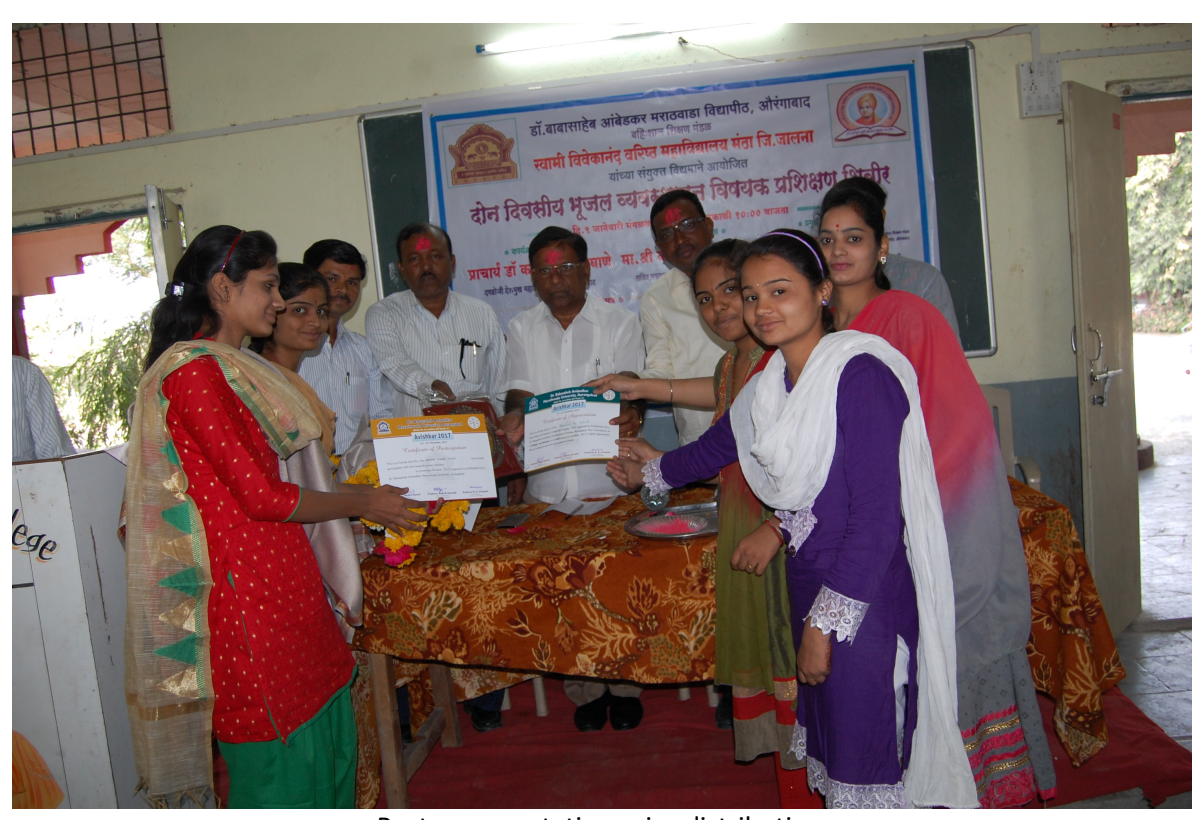
Poster presentation prize distribution