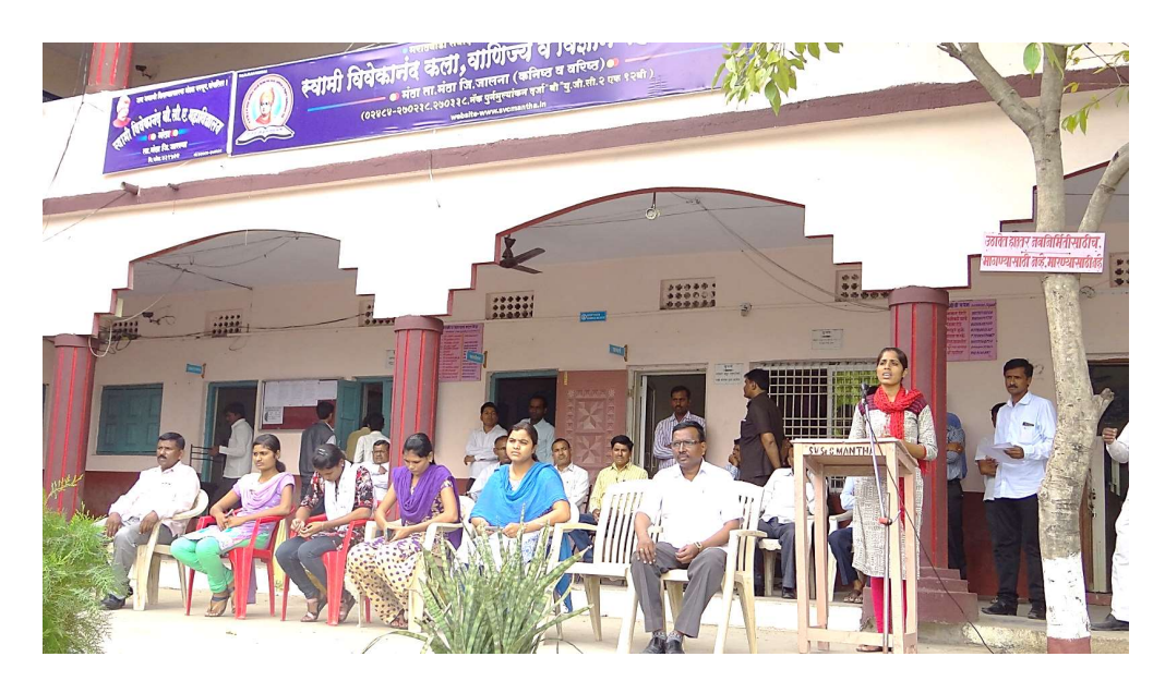
Damini Squad Member adderssing to studentsabout security tips for the girls