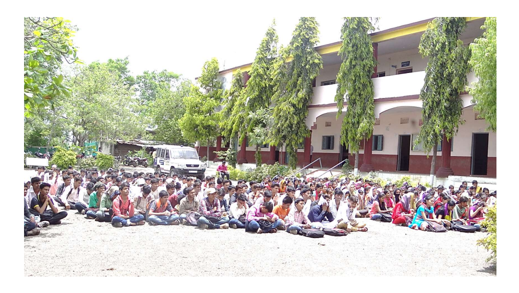
Students are listening to the Damini Squad Member