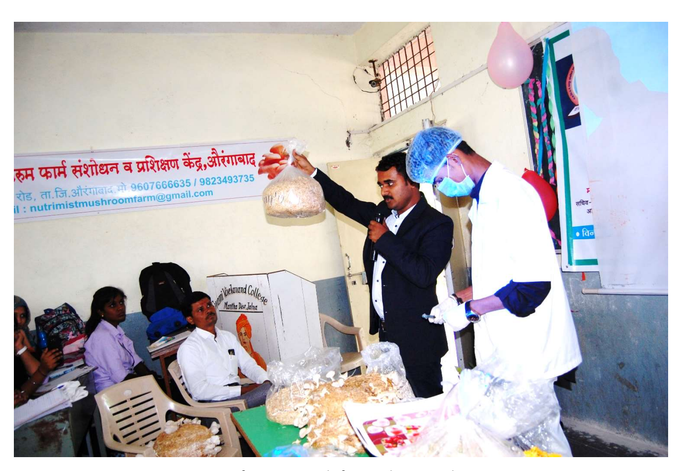
Bagging of raw materials for mushroom cultivation